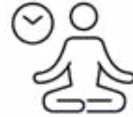
ምዝናይ ወይ ምስትንታን ኣዘውትር።