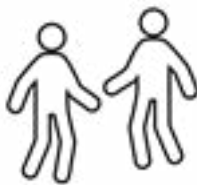
ምስ መጻምዲ ገለ ነገራት ግበር/ሪ።