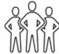
ምስ ጉጅለ ብምኻን ንጥፊታት ኣካይድ።