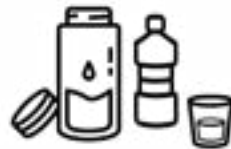
ብዙሕ ማይ ስተ።