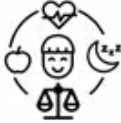
ሚዛናዊ-ነት ርኽብ ከምኡ ድማ ጸቕጢ ኣእምሮ ኣገድል።

ነፍስ ወከፍ ኣብ ታሕቲ ዘሎ መልእኽቲ "ናይ ጥዕና (ሓጎስን ምዝንጋዕን) ልምምድ" መንገዲ ይውክል። ብኸብረትካ ካብዞም ዝስዕቡ ንሓደ ወይ ካብኡ ንሓደ ግበር።