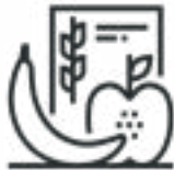
ዝያዳ ጽሕጎ (ፋይበር) ብላዕ።