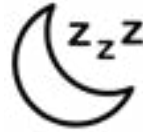
እኹል ድቃስ ርኽብ።