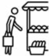
ሓድሽ ፍርያት ግዛእ።

ነፍስ ወከፍ ኣብ ታሕቲ ዘሎ መልእኽቲ "ናይ ጥዑይ ኣመጋግባ" መንገዲ ይውክል። ብኸብረትካ ካብዘም ዝስዕቡ ንኣደ ወይ ካብኡ ንላዕሊ ግበር።