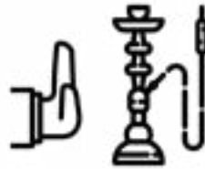
ምትካኽ ሺሻ ኣወግድ።