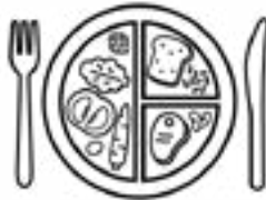
ዝተመጣጣኑ ምግብታት ብላዕ።