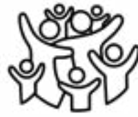
ምስ ጉጅለ ወይ ስድራቤት ብምኻን ተዘናጋዕ።