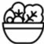
ዝያዳ ቆጻላት ኣሕምልቲ ብላዕ።