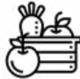
ዝያዳ ፍሩታን ኣሕምልትን ብላዕ።